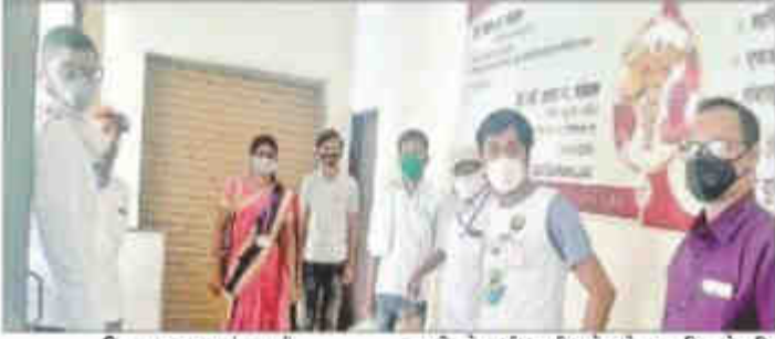
प्रियता खंवावदाता | परभणी

वर्तमान में कोरोना का संक्रमण न हो इसके लिए समूचे देश में लॉकडाउन जारी है। जिले की सीमा बंद होने से कई मजदूर, बेसहारा नागरिक परेशान हो रहे हैं। तो हाथ को काम न होने से कई मजदूरों को भूखे रहने की नीबत आयी है। दैनिक व्यवहार ठप्प हुए हैं। आर्थिक दृष्टि से दुर्बल, बेसहारा व बीमार मरीजों को जीवनावश्यक वस्तुओं की व्यवस्था करना मुश्किल हो रहा है। यह समस्या ध्यान में लेते हुए एचएआरसी संस्था ने विभिन्न उपक्रम से समाज के जरूरतमंद व्यक्तियों को मदद करना शुरू किया है।