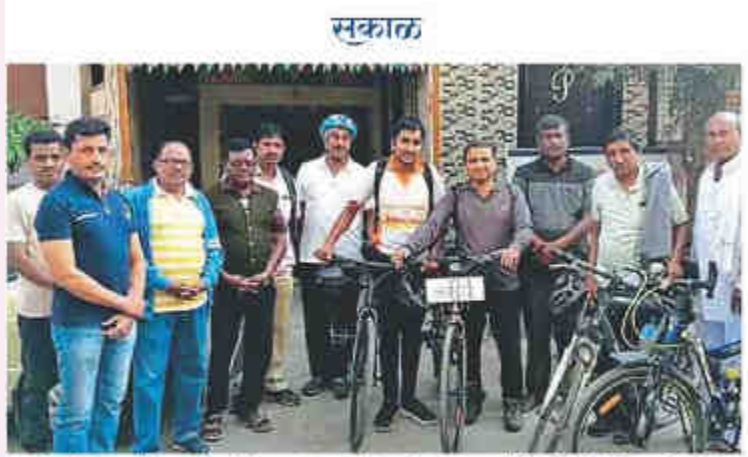
प्ररमणी : 'ग्र्चआवक्षी' एड्स विषयी संवादातून जनजागृती कार्जी माणून प्ररमणीतील होमिओर्पोधेक अकेडमी ऑफ रीसर्चे ऑण्ड चॅरिटीज परभर्णी व पेम साकक्तिले करूब यांनी शंभर किलोमीटर अंतरासी. सावकल फेरी कायली.