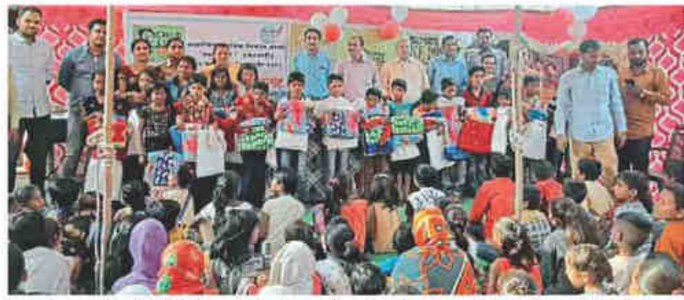
परमणी : एचएआरसी संस्थेतर्फे परभणी चाईल्डलाईनच्या कार्यालयात ११२ वंचित बालकांना विविध वस्तू भेट देऊन बालदिन साजरा करण्यात आला.

या वेळी ११२ वंचित बालकांना अँटीसेप्टिक सावण, ट्रथपेस्ट, ट्रथब्रश, चित्रकला साहित्य व सर्व