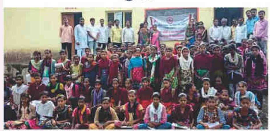
परभणीः एचएआरसी संस्थेतर्फे मांडाखळी (ता.परभणी) वेथील मांडव्यऋषी विद्यालयात विद्यार्थिनींना सॅनेटरी पॅड व जनजागृतीविषयक माहितीपत्रकाचे वाटप करण्यात आले.