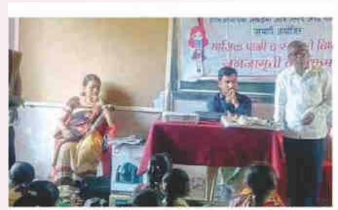
परभणी : होमिओपॅथिक अकॅडमी ऑफ रिसर्च अँड चॅरिटीजच्यावतीने जांब ता.परभणी येथील जिल्हा परिषद प्रशालेत मासिक पाळीतील स्वच्छतेविषयी जनजागृती करण्यात आली.