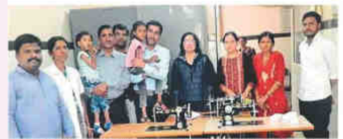
परभाषी : होषिओर्वेबिक अमेंद्रमी ऑफ रीसर्च जेंद्र चेरिटीज संस्थेच्या वतीने निराधार पुतरी व पहिलेस. तीन जिल्लाई बाजीन भेट म्हणून देण्यात आल्या.