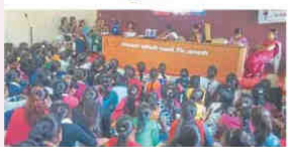
पार्थरी : होमिओपॅधिक अकॅडमी ऑफ रिसर्च अँड चॅरिटीज (एचएआरसी) परभणी या संस्थेतर्फे ब्रथवारी किशोरवधीन मुलीना मार्गदर्शन करण्यात आले.

पांचरी, ता. २२ (बातमीदार) : होमिओपॅथिक अकेंद्रमी ऑफ रिसर्च अंड चॅरिटीन (एचएआरसे) परभणी या संस्थेतर्फे बुधवारी (ता.२२) शिक्षण विभाग आणि पंचायत समिती यांच्या पुढाकारात्न मासिक पाळी बाबत किशोरवयीन मुलीना मार्गदर्शन करण्यात आले.