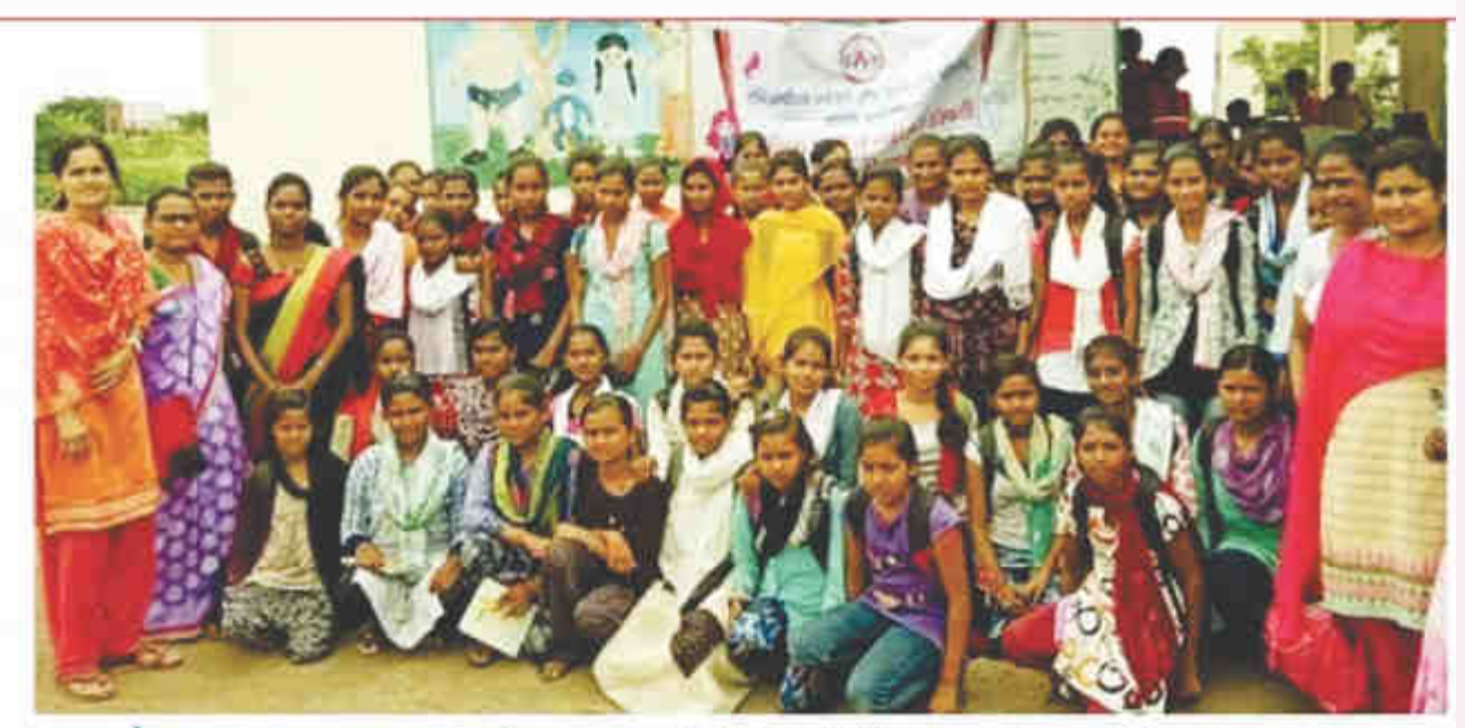
समूपदेशन ... वसमत तालुक्यातील आडगाव रंजे येथे विद्यार्थिनीसाठी समुपदेशन कार्यक्रमाचे आयोजन

Hello Hingoli Page No. 4 Sep 07, 2019 Powered by: erelego.com